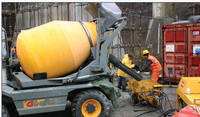
La pompa a cavità elicoidale B100 per calcestruzzo mentre viene alimentata da una betoniera nel cantiere del viadotto Ferriere

La sfavorevole posizione del cantiere, unitamente alla complessità dell'intervento, hanno reso necessaria la preparazione del betoncino reodinamico direttamente in cantiere, utilizzando la pompa a cavità elicoidale B100 della Bunker e gestendo così le fasi di pompaggio fino a una altezza di 80 m in modo economico e in completa autonomia.